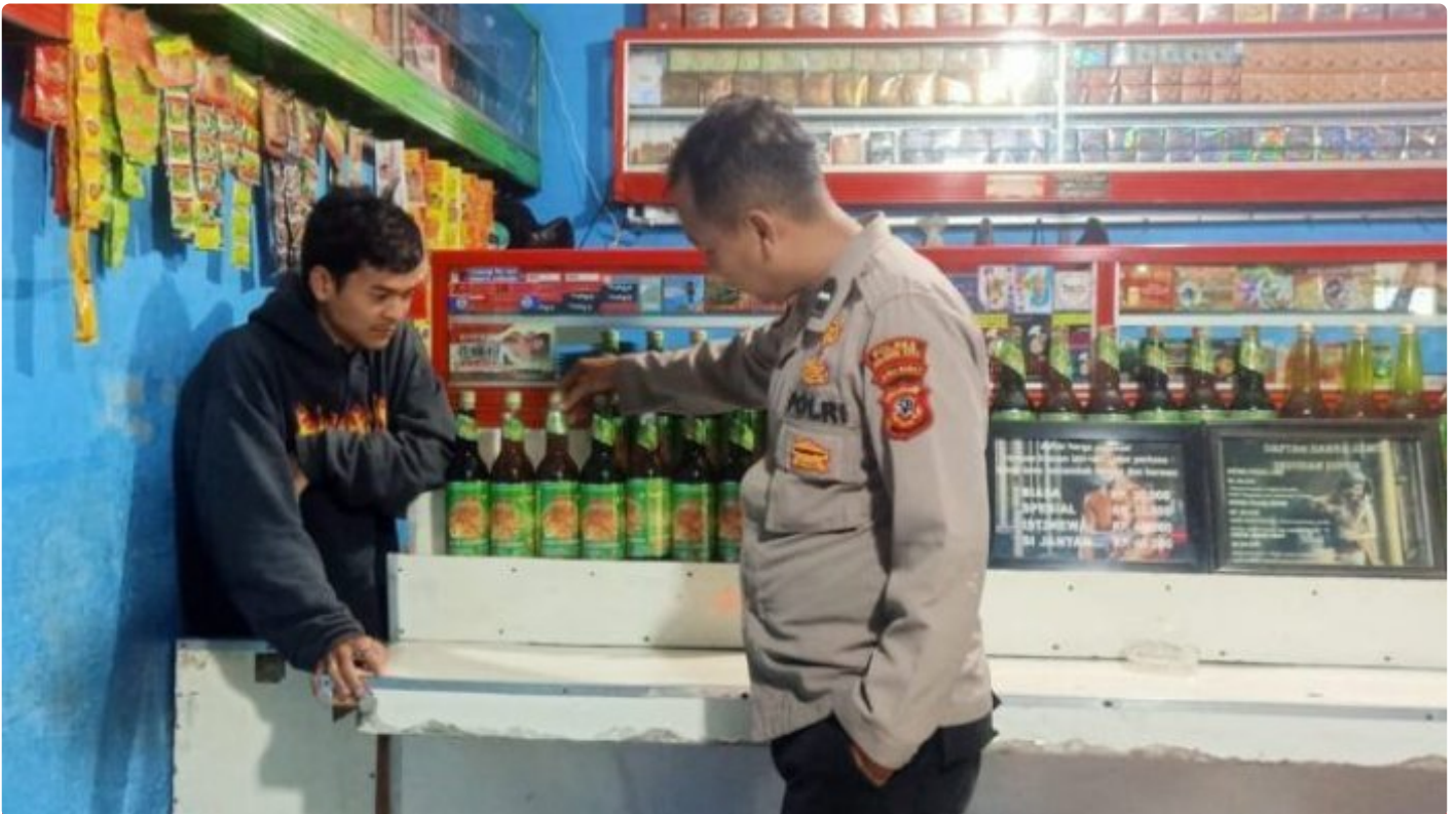
Polsek Sukalarang Polres Sukabumi Kota

Kota Sukabumi – Polsek Sukalarang Polres Sukabumi Kota Polda Jawa Barat, Laksanakan Patroli KRYD (Kegiatan Rutin Yang Ditingkatkan), untuk mencegah Peredaran Miras dengan menggelar Razia Miras Di Wilayah hukum Polsek Sukalarang, Rabu( 31/01/2024 ) malam.